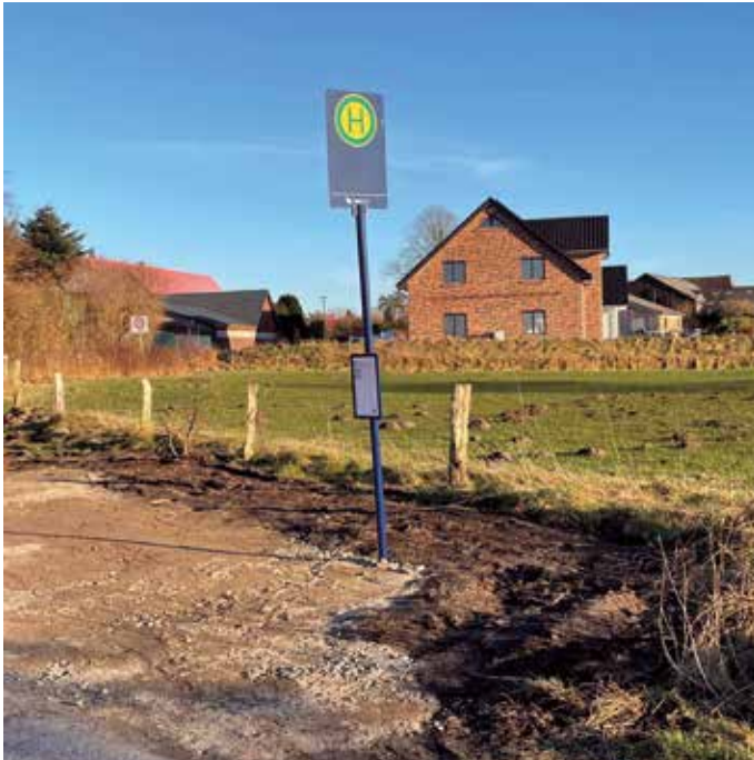
Neue Bushaltestelle im Norderende. Auf dieser Seite ist noch eine Beleuchtung geplant.