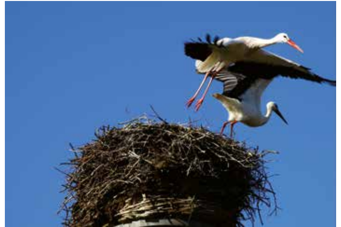
Das Storchenpaar verlässt das Nest im „Hemäcker“