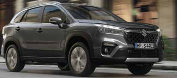
Abbildung zeigt aufpreispflichtige Sonderausstattung.